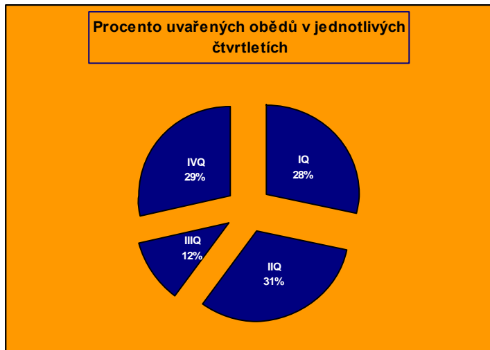
graf. č. 3

Zařízení školního stravování dováží stravu do 47 výdejních míst MŠ a ZŠ, výdejna MMO. Na 6 jídelnách + výdejna stravy MMO se vydává pro 2873 strážníků.